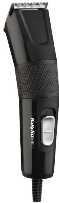
Made in China Fabriqué en Chine E756E - T156a